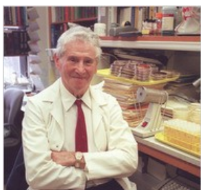
Dr. A.M. Kligman

La Corneoterapia verdadera describe las intervenciones preventivas necesarias para la corrección y reparación de la barrera del estrato córneo que se ha vuelto defectuosa y dañada por los muchos factores intrínsecos y extrínsecos de la vida. La metodología de la corneoterapia ha demostrado que se puede