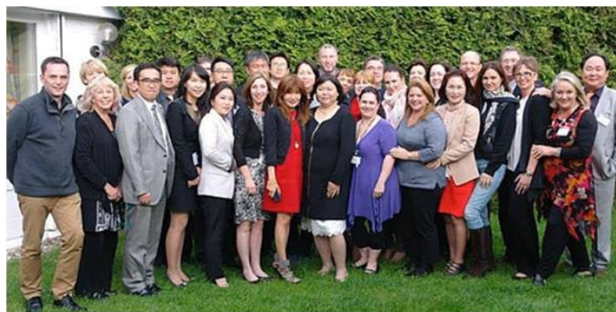
Asistentes y participantes en el Segundo Simposio Internacional de Corneoterapia, 2013